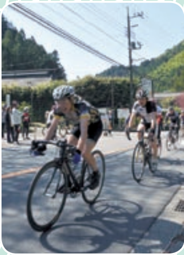
▲本部前を通過する選手達

タイムを競わないとはいえ、主流はロードレーサータイプの自転車でした。とても軽量の自転車で、重さは10Kgにも満たず、タイヤは非常に細く抵抗の少ない物を使用。20数段もある変速機が取り付けられ、スタンドも走行時に危険なためありません。無駄のない、