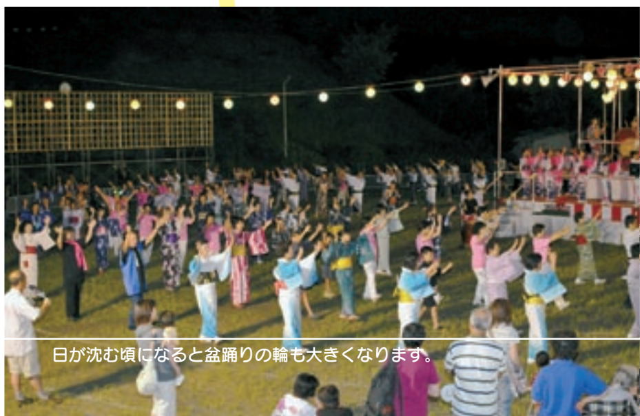
日が沈む頃になると盆踊りの輪も大きくなります。