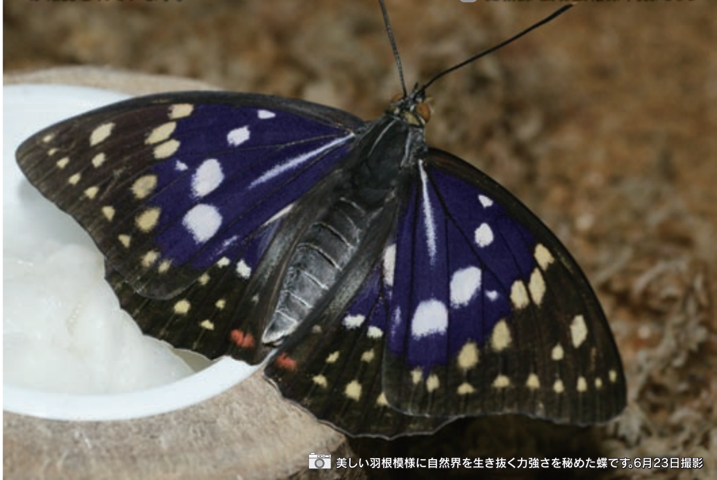
美しい羽根模様自然界を生き抜く力強さを秘めた蝶です。6月23日撮影