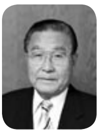
日の出町長 橋本聖二