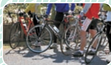
▲走ることに特化されたデザイン

※7月開催サマーステージから初級者向け(小4以上)5kmコースが新設されました。大会本部が置かれる肝要の里から、岩井付近に設けられたスタート地点へ自転車の