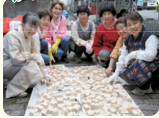
▲私たちが作っています。6月8日撮影