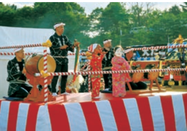
▲伝統芸能は各地域で大切に守られています。 郷土芸能を演じる元気いっぱいの子供たち。▶