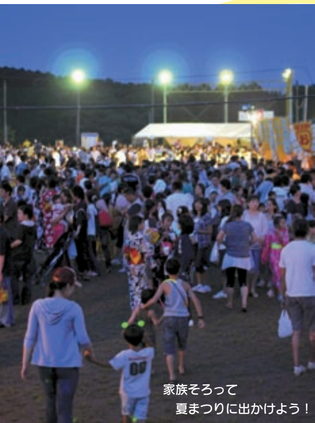
家族そろって 夏まつりに出かけよう！

日の出町の盆踊りは、舞踊連盟により行われます。代表する踊りとして「日の出音頭」があり、長く地域の皆さんになじみある音色とリズムカルな太鼓の拍子に合わせ踊ります。まつりが終盤に近づくと次第に膨らむ踊りの輪が地域のふれあいを感じさせます。