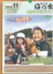
いも掘り 平成21年11月(484号)