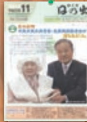
長寿万歳 祝100歳 平成22年11月(496号)