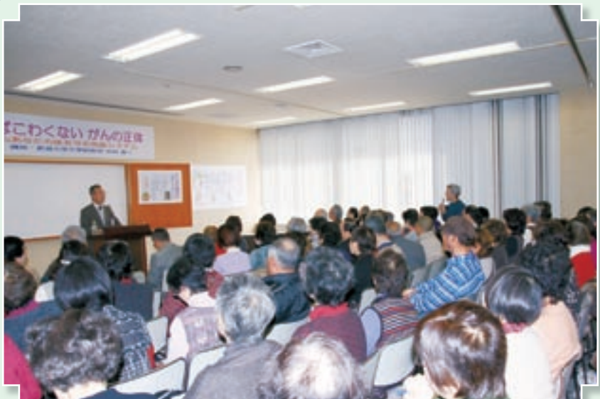
本当に多くの方が来場されました。