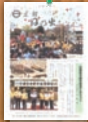
交通安全都市宣言 昭和63年5月(226号)