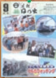
イルカウォッチング 平成15年9月(410号)