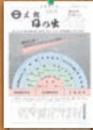
ユートピア構想 昭和60年12月(197号)