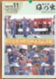
日の出町消防団活躍 平成17年11月(436号)