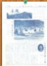
広報日の出新装発刊 昭和43年2月(20号)