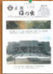
新庁舎の建設 昭和64年1月(234号)