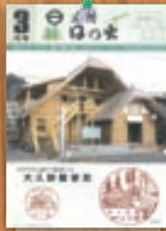
新装大久野郵便局 平成3年3月(260号)