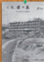
本宿小建設 昭和53年2月(103号)