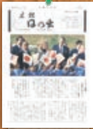
レーガン大統領来町 昭和58年12月(173号)