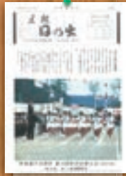
町制施行10周年町民体育大会 昭和59年11月(184号)