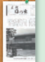
志茂町児童館開 昭和56年5月(14号)