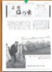
谷戸沢処分場着工 昭和57年8月(157号)