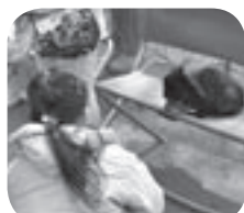
ごはんを食べるうさぎ