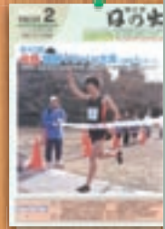
元旦マラソン大会 平成23年2月(499号)