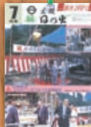
つるつる温泉誕生 平成6年7月(300号)