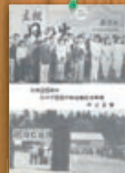
NHKのど自慢大会 昭和55年5月(130号)