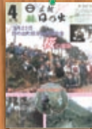
自治会長会桜植樹 平成11年4月(357号)