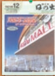
イオンモール日の出開店 平成19年12月(461号)