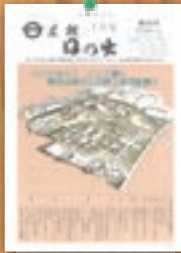
三吉野工業団地着工 平成2年1月(246号)