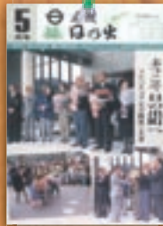
ゴルパチョフ元大統領 平成4年5月(274号)