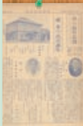
日の出村誕生 昭和30年7月(創刊号)