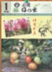
トマトハウス 平成3年1月(258号)