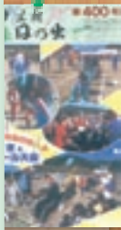
トボール大会 平成4年11月(400号)

昭和30年7月の創刊から、我が町日の出の架け橋として56年。 夢と希望を乗せ、広報日の出は、これからも町の皆さまと共に!