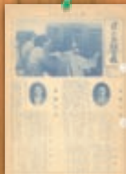
有線放送仮開通 昭和37年1月(18号)