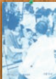
赤ちゃんコンクール 昭和50年12月(77号)