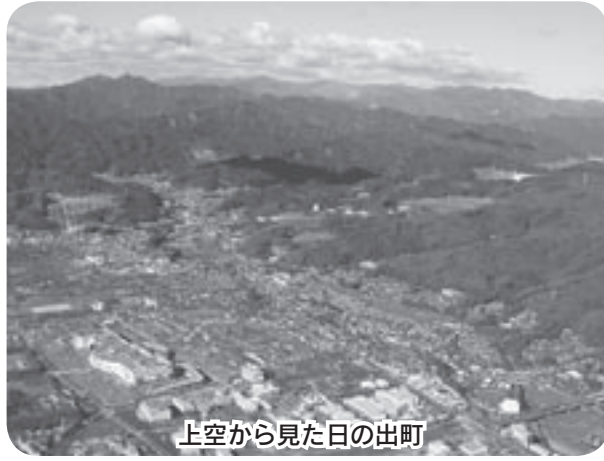
上空から見た日の出町

などを考え、基幹政策は堅持しつつも、見直すべきものは見直し、時代に合った先を見通せる施策の推進に努力してまいります。