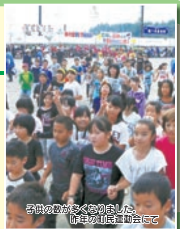
子供の数が多くなりました。昨年の町民運動会にて