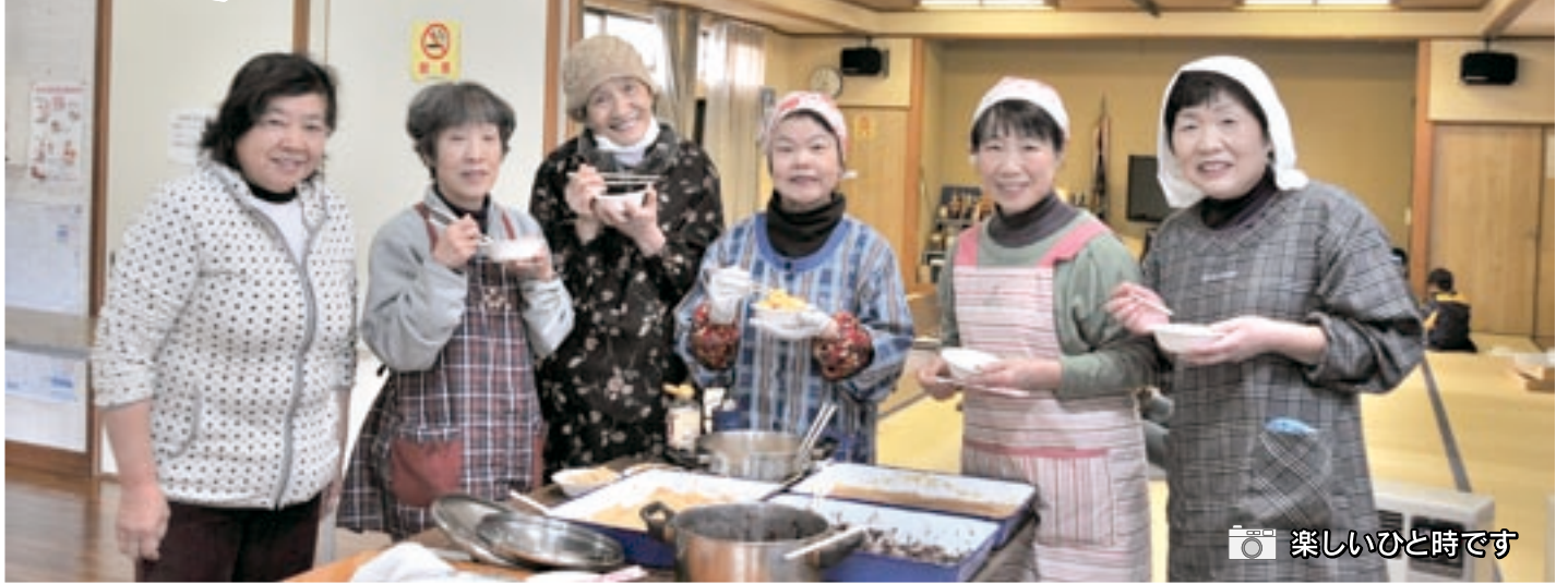
楽しいひと時です

新年あけましておめでとうございます 新春を前にお餅つき! よい1年でありますように