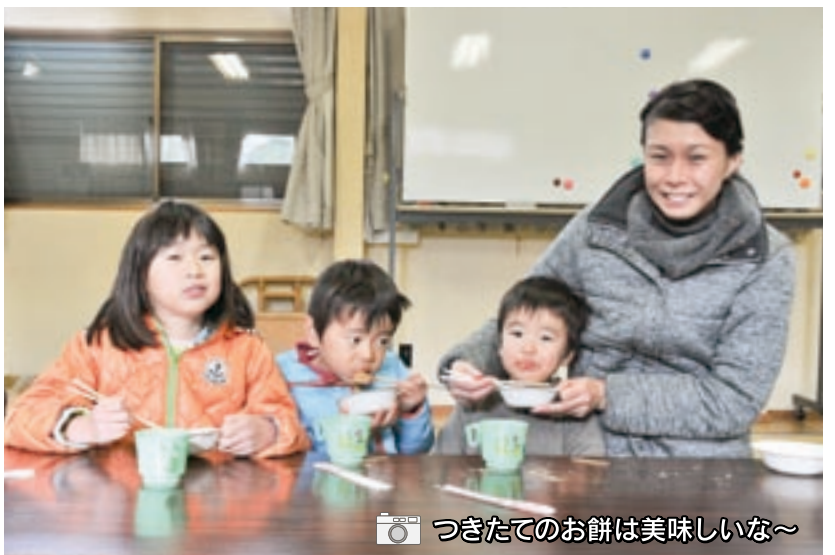
つきたてのお餅は美味しいな~

【第28自治会の年末餅つき大会にお邪魔しました】 12月15日(土)の年の瀬に、第28自治会の皆さんによる餅つき大会が開催され、橋本町長も参加して子どもたちと一緒に餅つきを楽しみました。子どもたちは、慣れない手つきで、大きな杵を振りかぶり、餅つきを体験。ついたお餅は、きなこ、大根おろし、あんなどに絡めて美味しくいただきました。