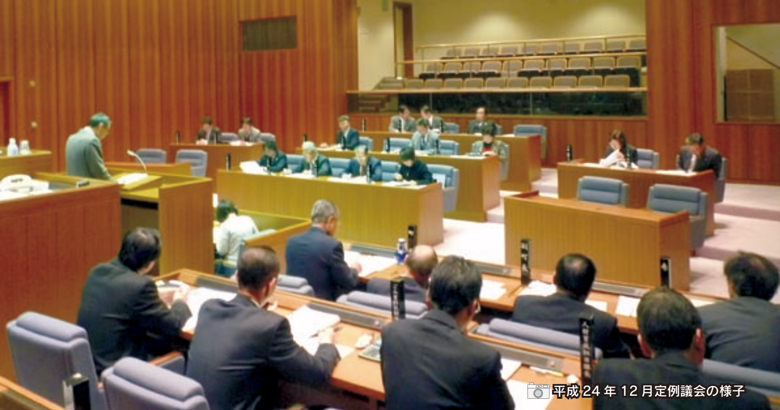
平成24年12月定例議会の様子