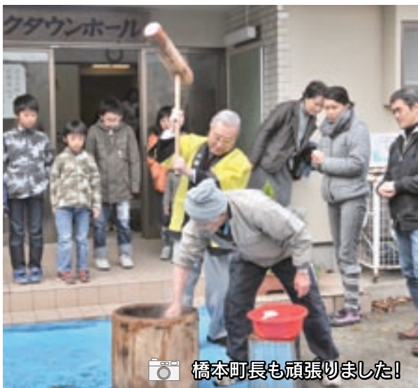
橋本町長も頑張りました!