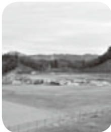
サッカー場整備の様子

新年あけましておめでとうございます。今年は9月28日(土)~10月14日(月)の間、スポーツ祭東京2013が都内各地で開催されます。近隣では、青梅市でカヌー競技、羽村市でバレーボール成年女子、福生市でソフトボール成年女子、あきる野市で自転車、馬術(成年男子・女子・少年)、ソフトボール少年女子、瑞穂町でソフトボール少年男子、奥多摩町・檜原村では自転車競技が正式競技として行われます。日の出町では、9月30日(月)・10月1日(火)にスポーツと文化の森・谷戸沢サッカー場で女子サッカー競技が行われます。サッカー競技の開催に伴い、昨年10月に着工したサッカー場とアクセス道路の整備も順調に進んでいます。広報では、スポーツ祭東京2013に関連する記事や、様々な情報を町民の皆さまへ発信してまいります。本年もよろしくお願ひいたします。