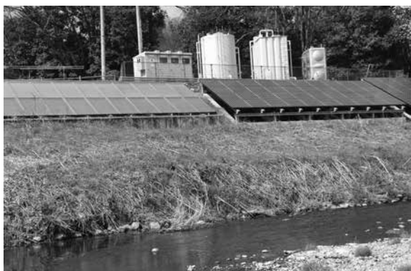
老人福祉センターの太陽光・熱発電

陽光発電設備設置の可能性がある。 医療・介護の連携について問う 質 現状と課題は。 課長 平成27年4月から取り組みを開始し、平成30年4月には、すべての市町村で実施。当町でも早い時期に実施したい。 質 市町村の役割は。 課長 市町村在宅医療と介護連携の相談窓口を設置する予定。