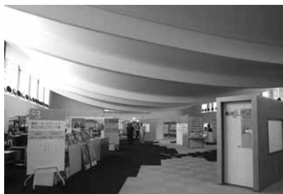
体育館を利用した庁舎内部の様子