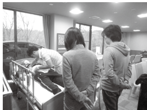
いつでもヘルパー養成講習の様子