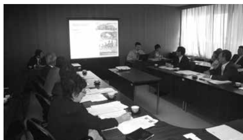
空き家対策について説明を聞く

点的に取り組んでいる。今後はリニューアルによる活用、空き家バンク、中古ストックの市場化等を検討する。