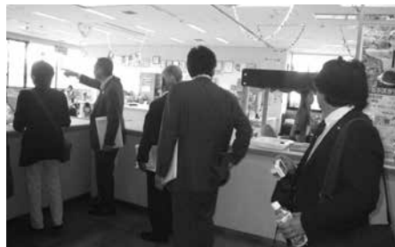
三条市での視察風景

5 年中児発達参観に関して、関係機関を説得し実施していく行動力も素晴らしいと感じた。