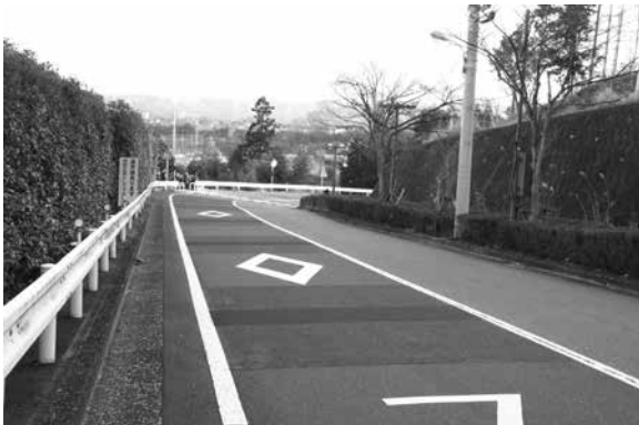
平井中学校前の道路

道橋を進めたい。 年齢別人口構成比の推移等を鑑みて問う 質 全世代の町民が平等に町独自の施策等を受けられるよう配慮していく上で、重要な基金の状況は。 課長 平成25年度、財政調整基金をはじめ、7つの基金で約17億5千4百万円である。 質 近隣の町村では、一般会計の基金総額で約50億円の自治体もあるが、目標額は。 課長 充実化が必要。