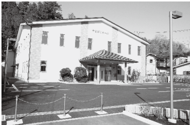
完成したやまびこホール 12月22日竣工

・日の出町やまびこホールの設置及び管理に関する条例 …… 可決 日の出町やまびこホールの完成に伴い制定するもの。