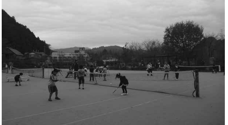
テニス教室の様子

「長期総合計画のスポーツの振興」について 質 長期計画で目標にしている体育施設の利用者数について。 課長 町民グラウンドは5年比較で51%増、ほかの施設については若干の増加傾向にあると思われる。芝のテニスコートの人気が高い。