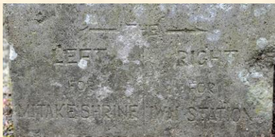
道標の根元付近に刻まれたローマ字の案内

右方向が「岩井停車場」、左方向が「御嶽神社」と記されています。これはこの道標の設置された頃は、この道が御嶽神社への表参道だったため、大久野から日の出山を経て御嶽神社に参拝する人々の往来が多く、その人たちが武蔵岩井駅を利用するだろうと見越して記された事が伺えます。また、ローマ字で記したのは、古い伝統から抜け出して新しい文化を取り入れていこうという意思があり、初期の青年団運動の特徴でもあります。