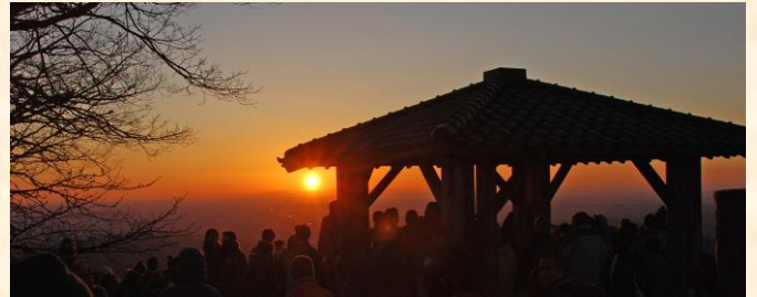
日の出山山頂での初日の出

がお勧めです。帰りはがんばって日の出町側に下山し「つるつる温泉」でひと休み。美肌の温泉で汗を流してリフレッシュして清々しい新年を迎えましょう。