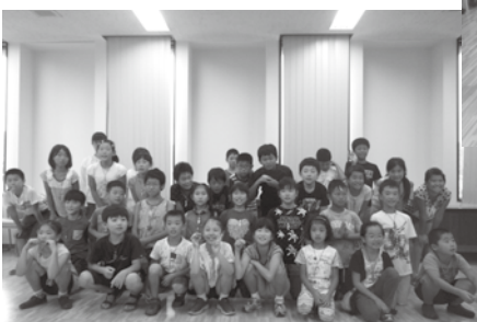
平井地区・まが玉作り