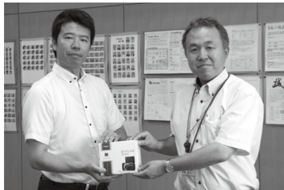
平井小学校校長室にて

平井小学校へ、デジタルカメラ2台、カメラケース2個、記録メディア2枚をご寄附いただきました。 オリンパス労働組合八王子支部様