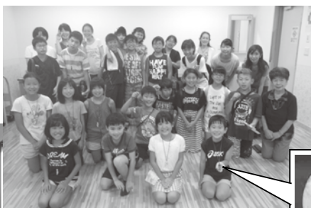
大久野地区・まが玉作り

夏休みに町内在住の小学3年生・中学生を対象に古代人体験教室を開催しました。延べ人数約100名のご参加をいただき楽しく「まが玉作り」・「縄文土器作り」・「アングーン編み」を行いました。来年も夏休みに開催予定ですので、どうぞ宜しくお願いします。