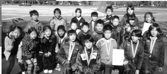
小学生の部「本宿ウォーターサプライズ」の皆さん