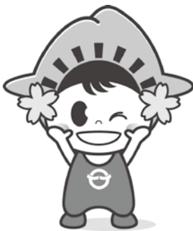
日の出町イメージキャラクター ひのでちゃん