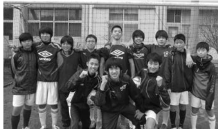
大久野中学校「サッカー部」

僕達サッカー部は2年生7名、1年生9名の計16名で活動しています。今の3年生はサッカー部員がいないため、1年生が入ってくるまでは試合出来る人数がいませんでした。でも今の1年生にサッカーが好きの子が多かったため、入部が多く、やっと試合が出来る人数になりました。なので、夏はサッカーに集中し、冬は体力作りなどを重視して1年生も2年生も頑張っています。特に2年生は、試合が出来る機会が少なかつたため、試合になるとすぐ力が入ります。一方練習では、お互いにプレッシャーがかからないよう、すごく