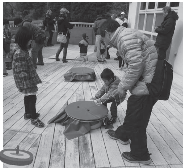
懐かしいベーゴマ遊び