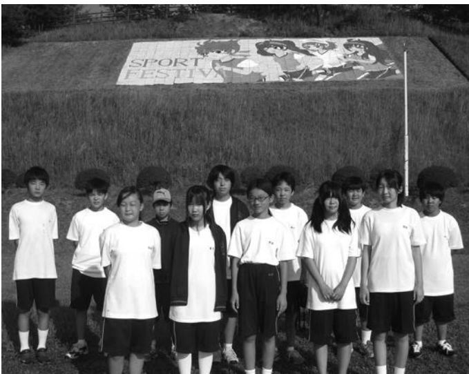
平井中学校「美術部」

くったりします。共同製作の1つは運動会で飾る大きな絵です。今年度は、部員の数が多かったため、デザインを変えて作り直しました。下書きがとでも大変でした。2つめは「m a d y m a d y 2013」という部誌です。イラストを中心として発行しています。3月の作品展には、個人製作と共同製作の作品を展示するので、ぜひ見て下さい。今後とも頑張って活動していきます。よろしくお願ひします。