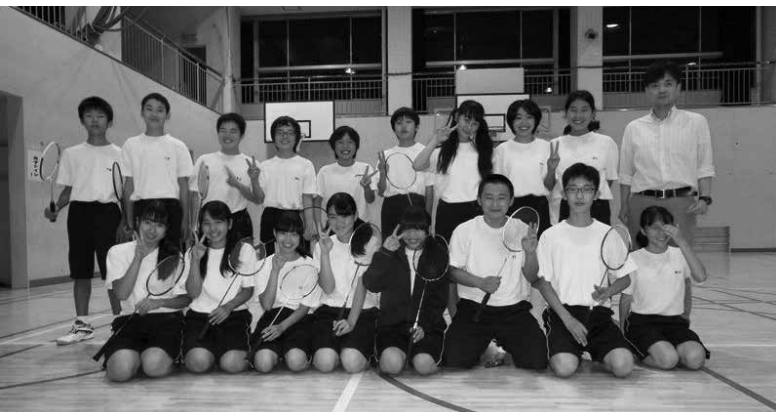
平井中学校「バドミントン部」

バドミントンは、シングルスとダブルスがあります。競技をする人は二人までなので、あまりチームプレーという感じではありま