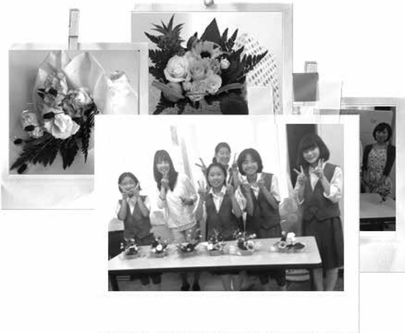
大久野中学校「華道部」