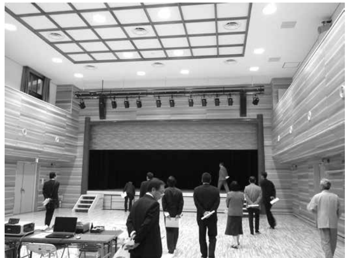
◎ 日の出町公民館に替わり新たに建設中（完成間近）の「(仮称)やまびこホール」の視察が行われました。（10月29日）