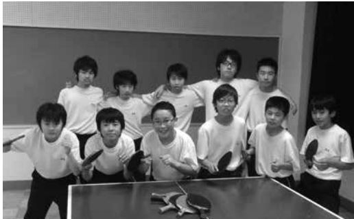
平井中学校「男子卓球部」

僕達の目標は8ブロックの団体戦でベスト8に入り、賞状を手にする事です。昨年先輩が達成した実績をしっかり受け継ぎたい