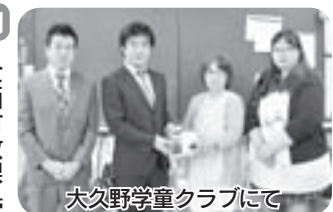
大久野学童クラブにて