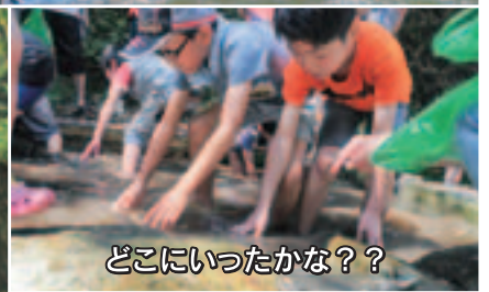
どこにいったかな??