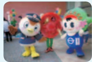
にしちゅん、トマト人間、ひのでちゃん