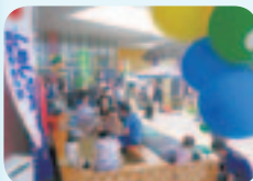
つるつる温泉「足湯」

ダンス発表会が行われたイオンモール日の出メインコートの南入り口では、ひので DAISUKI 観光フェアを開催しました。日の出山や町文化財の魅力発信、