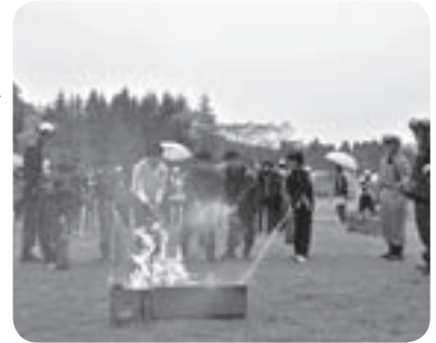
昨年の総合防災訓練で消火活動を体験する様子

また、携帯電話3社提供による、「緊急速報メール・エリアメール」(防災情報などを町内の各携帯電話に一斉配信するサービス)で訓練お知らせメールを送信しますのでご承知ください。(機種により受信設定が必要な場合や受信できない場合があります)