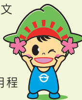
日の出町 イメージキャラクター 「ひのでちゃん」