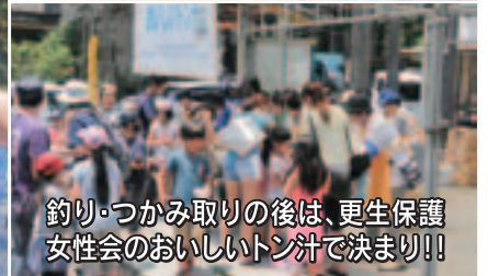
釣り・つかみ取りの後は、更生保護女性会のおいしいトン汁で決まり!!

社会を明るくする運動とは、全ての国民が犯罪や非行の防止、罪を犯した人たちの更正に理解を深め、地域の方で支援することで「犯罪のない明るい社会を築こう」とする全国的な運動です。