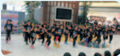
元氣いっぱい! 小学1年生、 3年生のダンス

7月12日(日) 元気いっぱい!ダンス♪ダンス♪ダンス♪ 町を代表する観光施設が町の魅力を発信!!