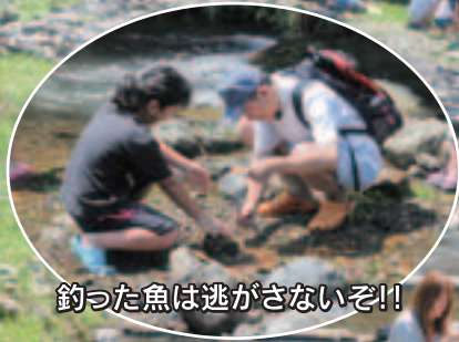
釣った魚は逃がさないぞ!!