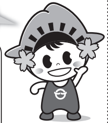
日の出町イメージキャラクター「ひのでちゃん」

撮影を行う広報職員は、施設管理者やイベント主催者などに承諾を得て、広報紙などへの掲載を目的として腕章をつけ撮影を行っています。撮影現場では、口頭での撮影承諾は行いませんが、万が一、撮影されたくないなどの場合は、撮影している職員までお申し出ください。