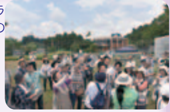
オオムラサキ放蝶の様子