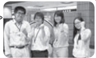
フレッシュな力に期待します