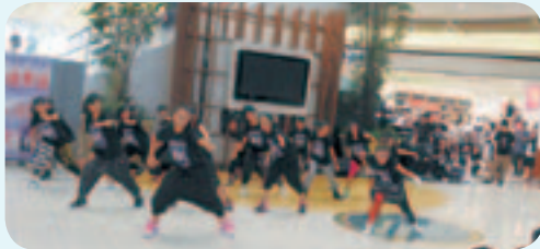
小学4年生、 中学3年生の 躍動感あふれる ダンス

子どもたちに大人気の「ヒップホップダンス教室」の発表会が、イオンモール日の出メインコートという素晴らしい舞台で行われました。