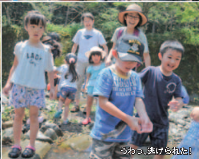
うわっ、逃げられた!