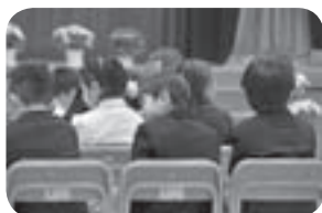
入学式 もうお友達ができたのかな?