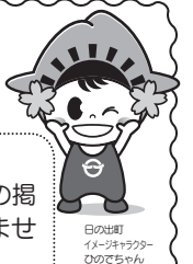
日の出 イメージキャラクター ひのでちゃん