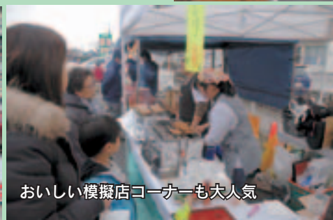
おいしい模擬店コーナーも大人気

コーナーも設置され、会場にはたくさんのお客さんが詰めかけていました。観光協会事務所は、土日にもオープンしています。ぜひ、お立ち寄りください♪