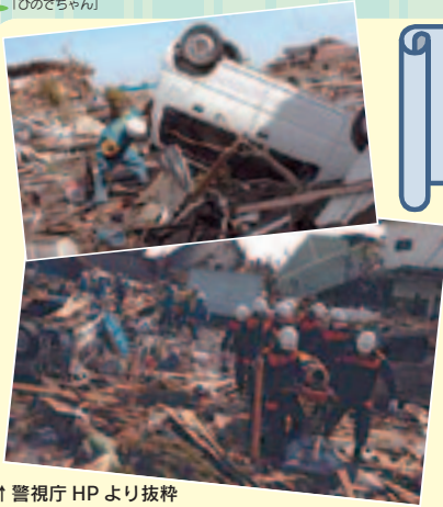
↑ 警視庁 HP より抜粋