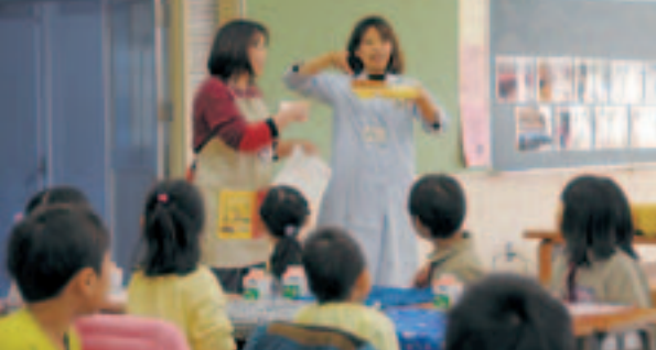
給食センター栄養士さんのお話