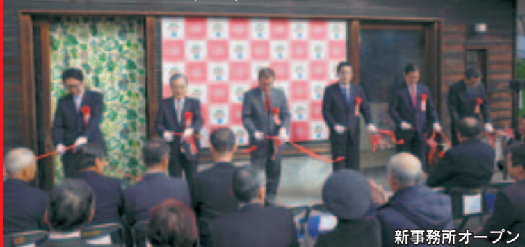
新事務所オープン