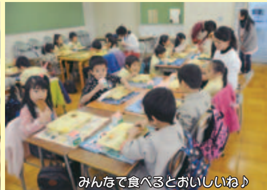
みんなで食べるとおいしいね♪