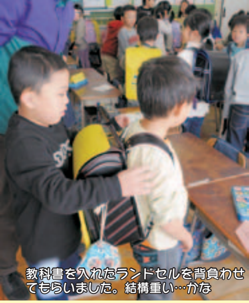
教科書を入れたランドセルを背負わせてもらいました。結構重い…かな