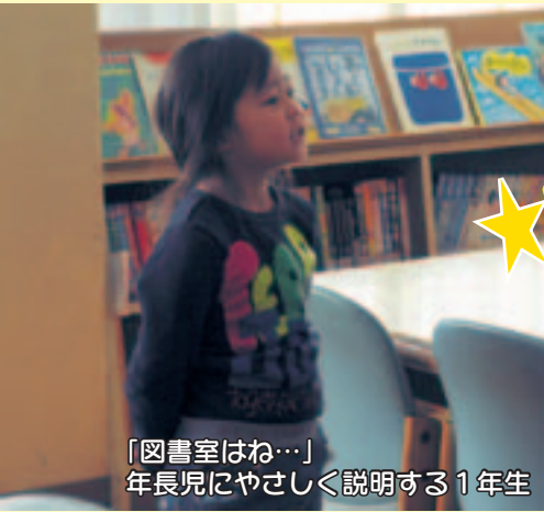
「図書室はね…」 年長児にやさしく説明する1年生