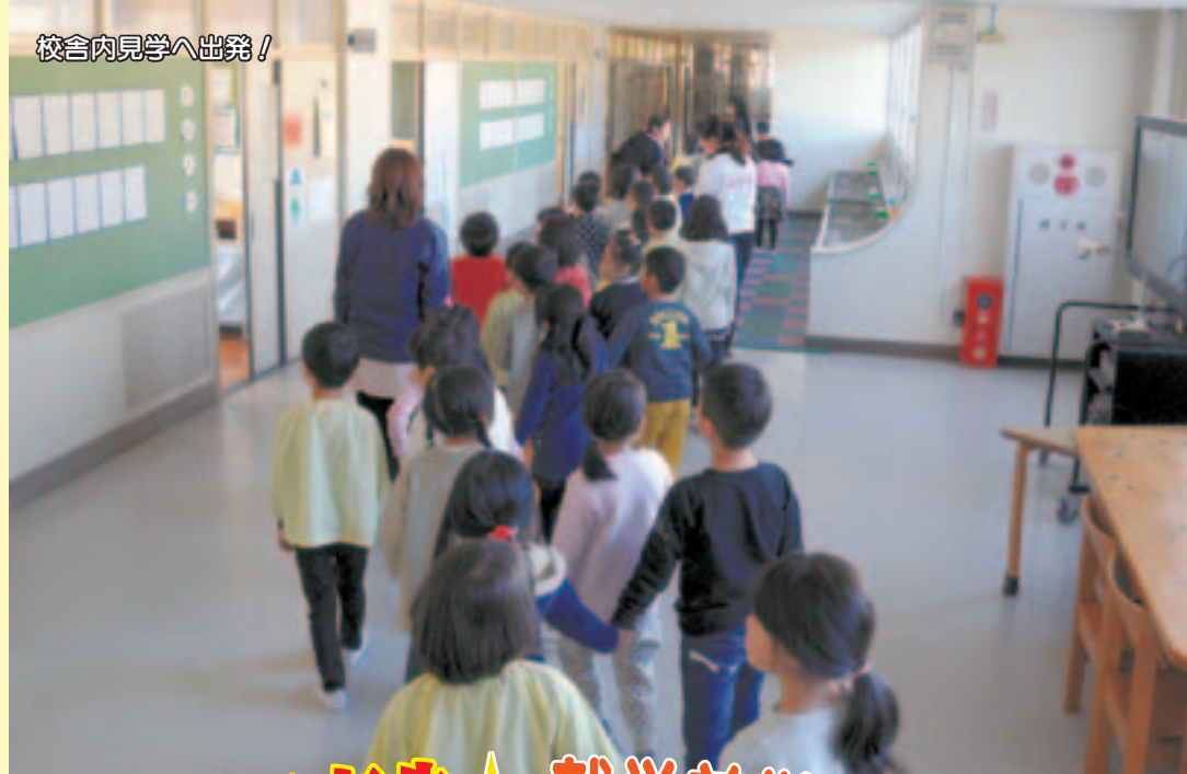
校舎内見学へ出発！