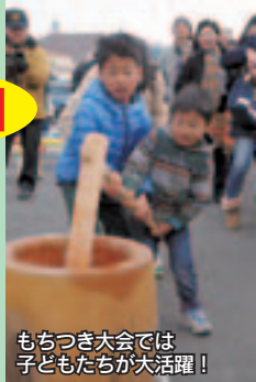
もちつき大会では子どもたちが大活躍！