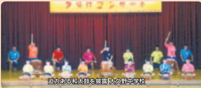
迫力ある和太鼓を披露 大久野中学校

ンクールに出場した楽曲の素敵な歌声と、和太鼓による力強い演奏を披露しました。さらに、本宿小の吹奏楽クラブは有志とともに休み時間や放課後、そして夏休みを返上しての猛練習の成果を存分に発揮した素敵な演奏を披露、また平井中とのコラボも見事でした。そして最後は平井中の吹奏楽部。歌やダンスも取り入れた楽しい演奏で、会場を大いに盛り上げてくれました。