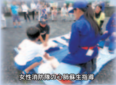
女性消防隊の心肺蘇生指導

自治会が主体となり実施した防災訓練は、各自治会で、安否確認、要配慮者及び避難行動要支援者救助、初期消火や応急救護訓練など工夫を凝らした訓練を行いました。