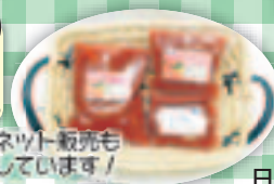
ネット販売も しています!