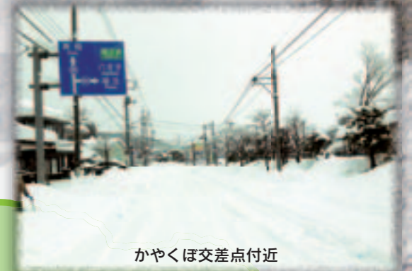
かやくぼ交差点付近

※平成26年2月14日～15日にかけて大雪になったときの天気図。低気圧が発達しながら本州の南岸を北東へ進みました。こんな天気図に寒波が絡んだときは大雪に注意！！