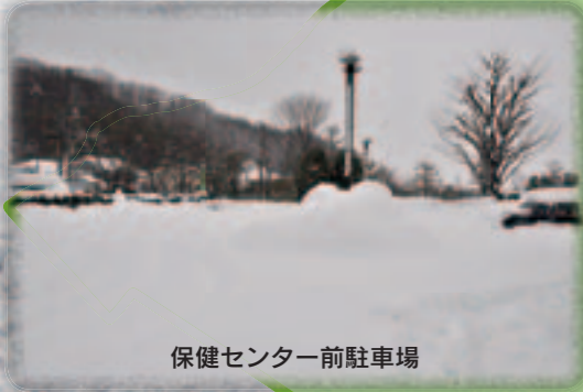
保健センター前駐車場