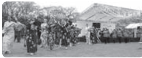
昨年の桜まつりの様子