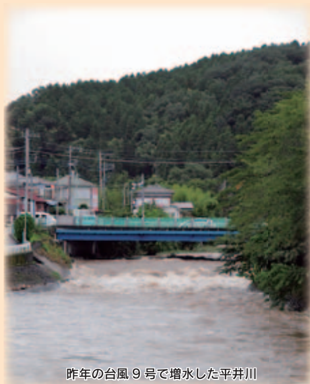
昨年の台風9号で増水した平井川