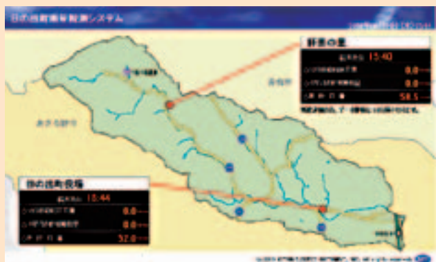
日の出町雨量観測システム

町や自治会等で行う防災訓練に参加しましょう。また、災害時に隣近所で助け合いができるような体制を整えましょう。