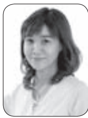
声優 山口由里子氏