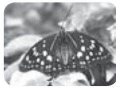
国蝶オオムラサキ

第3回 午後1時30分～2時30分 申込 不要(直接会場へお越しください) その他 運動靴など歩きやすい靴(ヒール靴不可)、帽子、飲料、雨具(台風などの荒天でなければ実施します)