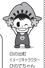
日の出町 イメージキャラクター ひのでちゃん

■取材班は腕章をしています。撮影にご協力をお願いします。 撮影を行う広報職員は、施設管理者やイベント主催者などに承諾を得て、 広報紙などへの掲載を目的として腕章をつけ撮影を行っています。撮影現場では、 口頭での撮影承諾は行いませんが、万が一、撮影されたくないなどの場合は、 撮影している職員までお申し出ください。