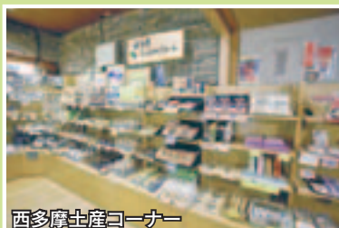
西多摩土産コーナー