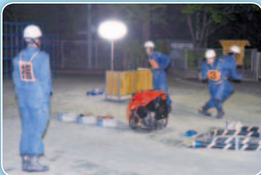
練習に励む選手達