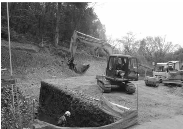
造成工事等が始まった野鳥の森管理棟施設予定地

質 サッカー場の芝生蘇生に砂を用意できないか。 課長 今後、処分場に影響のない砂を用意していきたい。