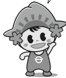
日の出町「ひのでちゃん」