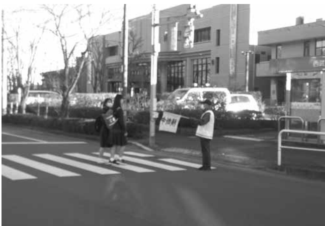
交通指導員の様子

課長 ひので！ニュー5大作戦を主要な優先事業として実施している。事務事業は事務事