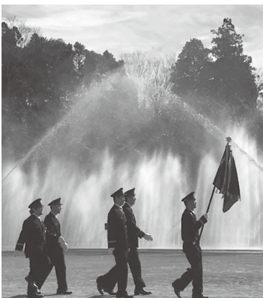
消防団出初式の様子

課長 災害現場を映像で確認でき、状況判断もできることから検討していきたいと考えている。