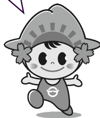
日の出町「ひのでちゃん」