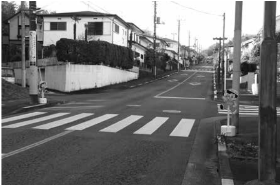
日の出団地内の交差点

警察、自治体、地域住民一体となった方法でこの問題を解決していく必要があると思いい、費用が掛かる場合は協力していきたい。