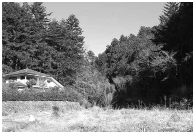
埋立て計画のある山林

質 残土埋立ての状況について伺う 質 玉の内地区の残土埋立て終了後の状況は。 課長 昨年11月28日に工事が完了し、1年が経過しましたが、その間、台風や局地的豪雨もありましたが、現在は異常なく安定した状況にある。町では、東京都多摩環境保全事務所と連携し、地元自治会が心配されている盛