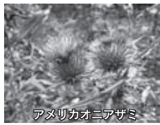
アメリカオニアザミ

また鋭いトゲがあるため、触つてケガをする恐れがあります。町内でも繁殖が確認されているため、ご家庭の庭など所有地などで繁茂している場合は、丈夫な厚手の手袋などを使用し、出来るだけ駆除してください。 ようお願いいたします。 駆除の際は、草刈り鎌などで刈るか、スコップで周囲の土ごと掘り返すと効果的です。