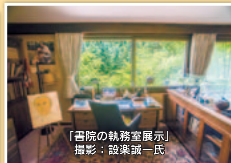
「書院の執務室展示」