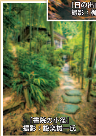
「書院の小径」

【優秀賞】（順不同） 柳川卓哉氏 「日の出山荘物語」 塚田照男氏 「歓迎します」 設楽誠一氏 「書院の小径」 設楽誠一氏 「書院の執務室展示」