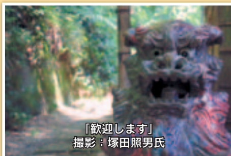
「歓迎します」

【優秀賞】（順不同） 柳川卓哉氏 「日の出山荘物語」 塚田照男氏 「歓迎します」 設楽誠一氏 「書院の小径」 設楽誠一氏 「書院の執務室展示」