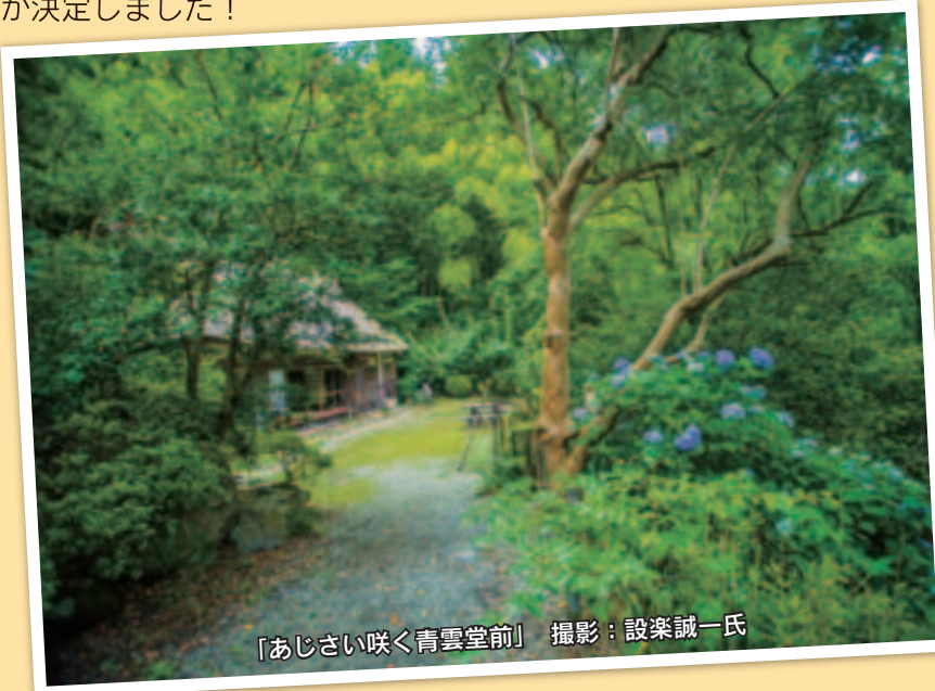
「あじさい咲く青雲堂前」