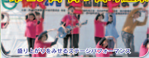
盛り上がりを見せるステージパフォーマンス