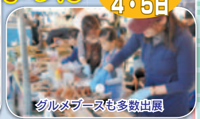
グルメブースも多数出展

町内の産業が一堂に会し、2日間で約10,000人の方が来場し大盛況となった産業まつり。会場には、町内事業者の皆さんをはじめ、多くのブースが軒を並べ、ステージでは様々なパフォーマンスが繰り広げられました。恒例のチャリティーオークションには、多くの皆さまから商品をお持ちよりいただき、中には人気の掃除機も。