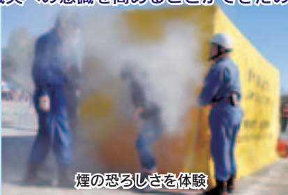
煙の恐ろしさを体験

当日は1,055人の町民の方が参加し、災害発生時に的確な行動がとれるような様々な訓練を体験しました。普段できない貴重な体験ができたという声も聞かれ、今回の訓練で、いつ起こるかわからない自然災害への備え、防災や減災への意識を高めることができたのではないのでしょうか。