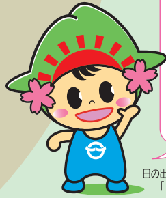
日の出町イメージキャラクター「ひのでちゃん」

本格的な春が やってきました♪ 4月7日の 「桜まつり」ぜひ、 遊びにきて くださいね！