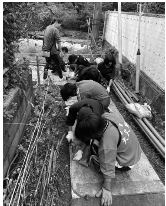
大久野中学校2年生 女子ソフトテニス部 ボランティア活動の様子

ことがない災害対策本部運営を行った。運営して得た結果として、避難された方から、町内の被害情報についての問い合わせが多かったと報告があり、今後、情報提供方法やその内容を検証していく。また、被害状況や対応