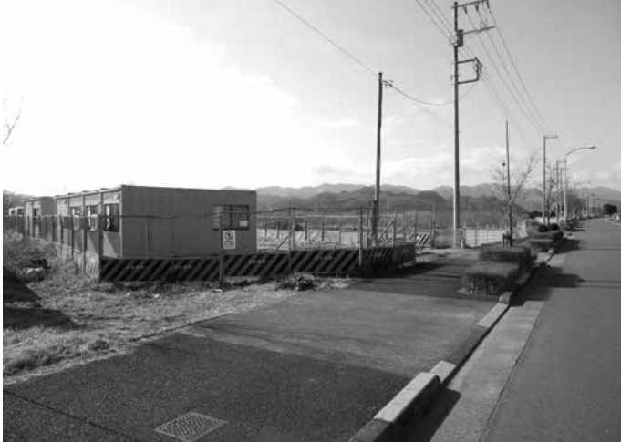
工事が停止されている 武蔵引田駅北口土地面整理事業

る野市相互の負担金で運営している駐輪場整理やトイレ施設管理があるが、工事停止期間や中止における影響は示されていない。また、あきる野市と話し合いを始めた事案はあるが、町として、区画整理事業に沿って具体化した事業はない。現時点では状況を見守る段階だと考えている。