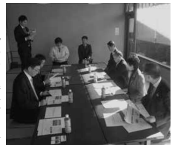
沼田市 道の駅 白沢にて

その一環として、一定の条件を満たす農産物の「ぬまた」ブランド認証や6次産業化計画を有する農業者の認証制度を設け、新商品開発、海外への販路拡大、市場ニーズとのマッチングなどの支援に市が取り組んでいることは注目している。総合的に見ると、好立地に関連する施設を集中し、さらに市民向けの福祉センターも併設し、施設全体の価値を高めている点は大いに参考になると考える。