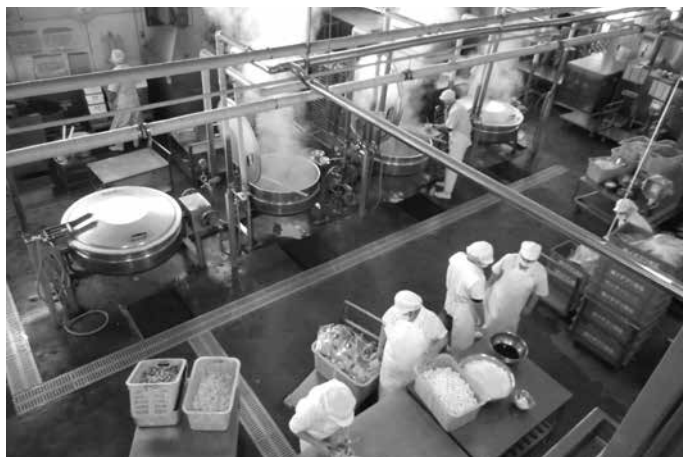
学校給食センター調理場

災害について 質 平井川の災害状況と、その対応は。 町長 町内各所で土砂崩れや道路冠水等の災害が発生、復旧対応を継続的に実施している。今後も関係機関との連携・協力により一日も早い復旧に全力を挙げたい。