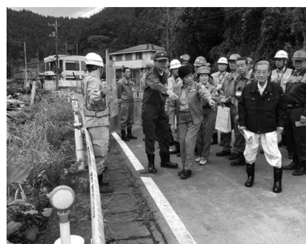
10月16日 小池都知事現場視察