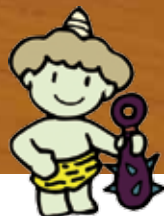
志茂町児童館「親子サロンにて」