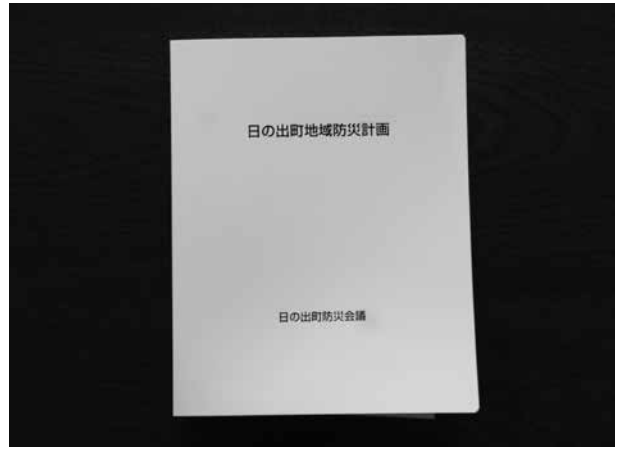
日の出町地域防災計画

今後の地域防災計画改善のために問う 質 災害対策本部の設置及び運営に関し、実際の運用方法を伺う。 課長 地域防災計画では「台風、暴風雨、集中豪雨等による風水害及びその他大規模な事故災害が発生した場合は、災害対策本部設置以前に、災害応急処理体制をとり、初動対応を行う。」とある。実際の運用方法は、災害が発生する前の初動段階