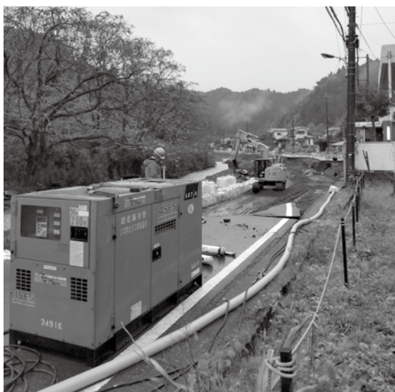
都道184号線災害復旧現場作業