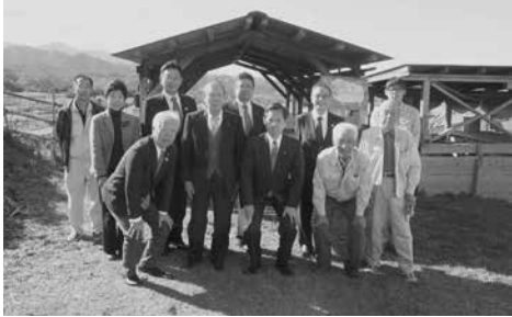
甘楽町 甘楽ふるさと農園にて

群馬県では「土砂等による埋立て等の規制に関する条例」を制定し、県下の市町村にもその制定を推奨し