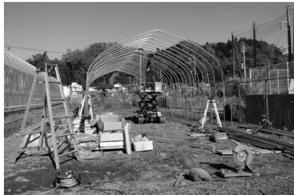
新規就農者向け補助事業により建設中のパイプハウス

担い手不足に直面する農業政策を問う 質 耕作放棄地対策など農業活性化策を伺う。 町長 高齢化や担い手不足による耕作放棄を克服して活力を取り戻すことは待ったなしの課題。農業者育成と農地保全を主要施策に掲げ、農業委員会による農地パトロールや都補助金を活用した支援の取り組みを行っている。