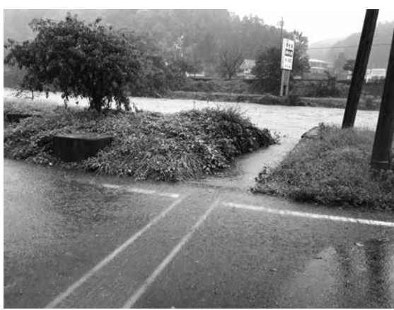
平井川 鹿の湯橋上流の増水