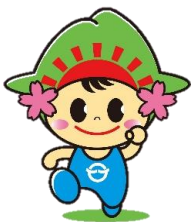
日の出町「ひのでちゃん」