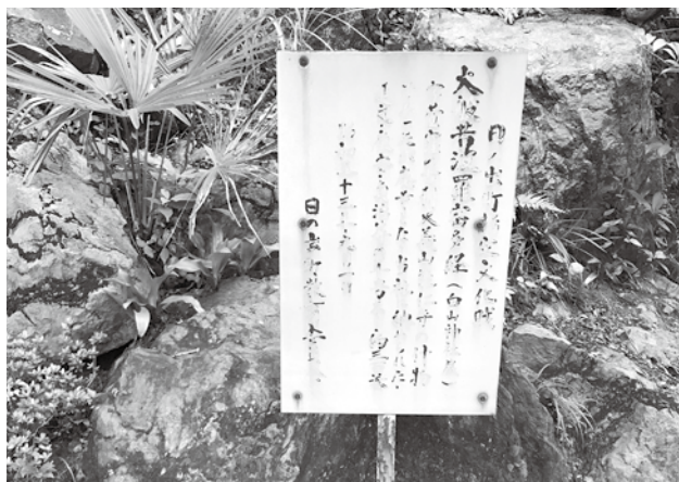
見えづらい説明版

文化財説明板設置長期計画は必要はないが、予防保全の観点から改修を行う場合には充分精査した上、一定期間を設定して行う。