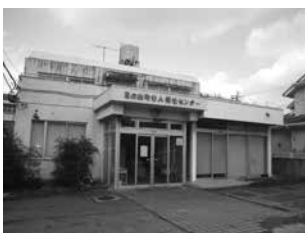
解体された老人福祉センター