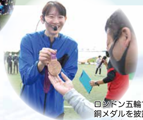
ロンドン五輪での 銅メダルを披露し てくれました