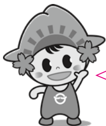
日の出町 「ひのでちゃん」

新型コロナウイルス感染症対応地方創生臨時交付金は、新型コロナウイルス感染拡大を防止するとともに感染拡大の影響を受けている地域経済や住民生活を支援し、地方創生を図るため、地方公共団体が地域の実情に応じきめ細やかに必要な事業を実施できるよう、国が創設した事業のことです。