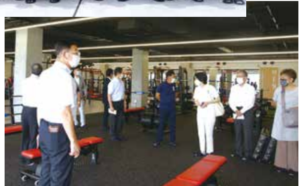
ASIA SPORTS CENTER ASIA SPORTS FIELD