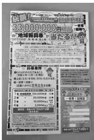
ひのでのお店再・発・券！(第3弾)事業