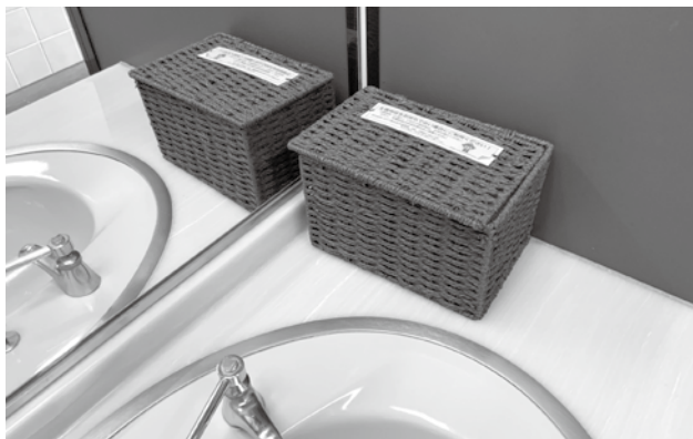
来庁者トイレの生理用品

A (課長) 研究を行っている。「子ども権利条約」では、子どもの生きる権利として、住居の確保・食料の確保、育つ権利として、勉強や遊びを通して能力を十分伸ばし成長できること。守られる権利として、紛争や暴力・搾取から守られること。参加する権利として、自由に意見を表明したり、団体を作ったりできること。これらを踏まえ網羅できるように町として、明文化に向け検討を進め、いいものを作りたいと考えている。