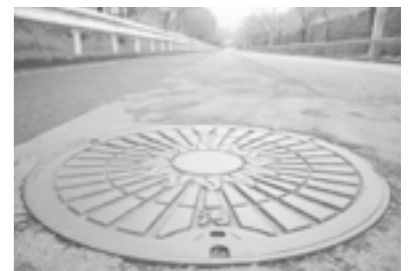
整備率100%を達成した公共下水道

◎ 前年度と比較し増額となっているが、その内容は A 保険の給付割合は、保険料を平成18年～20年の3カ年を出し、18年度8億1600万円・19年度8億3000万円・20年度8億5000万円と想定、積算して50%とし、国が20%・都が12.5%・町が12.5%・調整交付金5%となっている。 ◎ 包括支援センター運営を委託で運営しているが職員体制と介護予防のケアマネジメンツの数は A 保健師・介護士・福祉士で実施しており今後、看護師が入る予定。ケアマネジメンツの該当者は110人程度である。 ◎ 町が実地検査を実施することになったが予定は A 今後、予定し実施する。