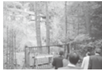
都市建設常任委員会で日の出山荘を視察

◎ 日の出山荘入館料の算出根拠と商工会が出した要望書その後の状況は A 入館料は200円×95日×10人で算出している。商工会から山荘内に売店をという要望を頂いているが、今後現場を見ていただき検討させて頂きたい。