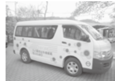
利用者にも好評な高齢者外出支援バス

◎ 消防ポンプ自動車置換えとメール配信の内容について A ポンプ車は第3分団第1部に納入する。メール配信については消防団員への緊急災害連絡や消防関係情報の配信また登録した住民に対しても選挙速報・不審者情報などの配信を考えている。 ◎ 重点支援指定校の実施内容 A 平成16年度から平井小を中心にスタートしたもので、ここで全小学校の足並みが揃った。英語教育の小学校全年導入や漢字検定の一斉スタートで学力の向上を目指している。