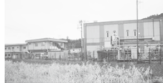
安心しておいしい水を供給する大久野浄水所

◎ 東京都への最終移管年度はいつになるのか A 平成21年度(22年3月31日まで)をもって終了となる。 ◎ 浄水費・給水費等が廃目になった理由は A 平成19年度から東京都の予算で賄われるため廃目となった。