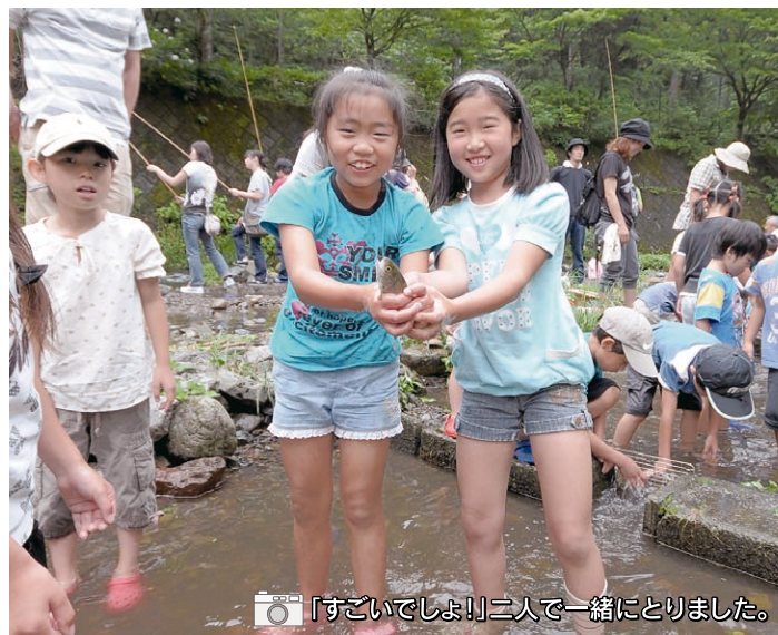
📷 「すごいでしょ!」二人で一緒にとりました。