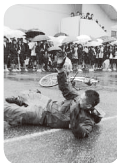
▲事故の恐ろしさを体感