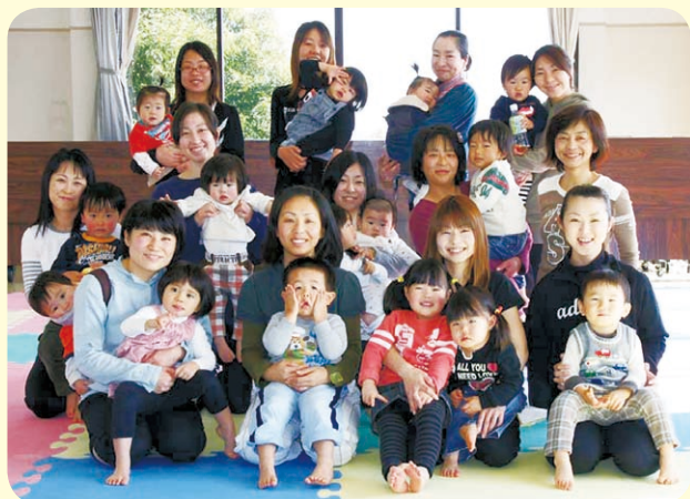
▲笑顔で元気いっぱい！ 写真は「すくすく会親子体操」にて