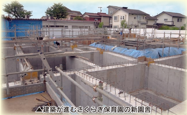
△建築が進むさくらぎ保育園の新園舎

子どもが増加することで課題も生じました。 最近是不況の影響から働きに出るお母さんが増えている事もあって、今までほとんどなかった保育園の待機児童が、日の出町でも平成 20 年度ごろから発生するようになりました。