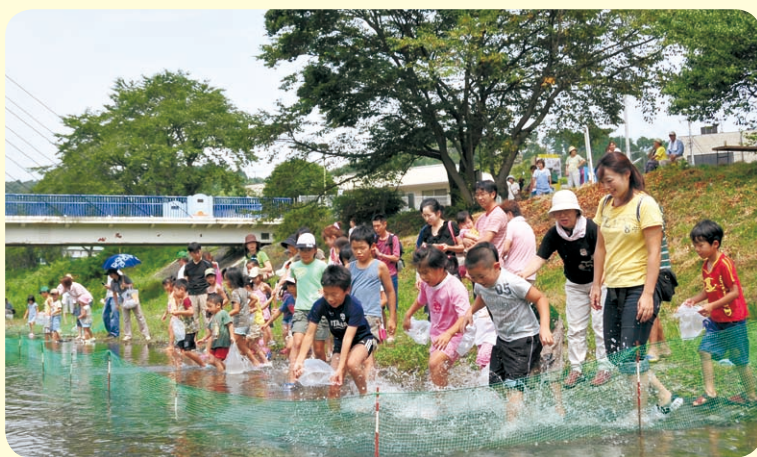
▲清流平井川でのマスのつかみ取り。町の子どもたちは元気いっぱい！