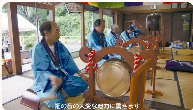
鉦の音の大変な迫力に驚きます

ここに鉦に関するエピソードがあります。戦時中、資源の乏しい日本では、軍需資源として金属製品は国に供出されていました。