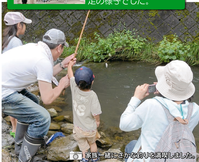
📷 家族一緒にさかな釣りを満喫しました。