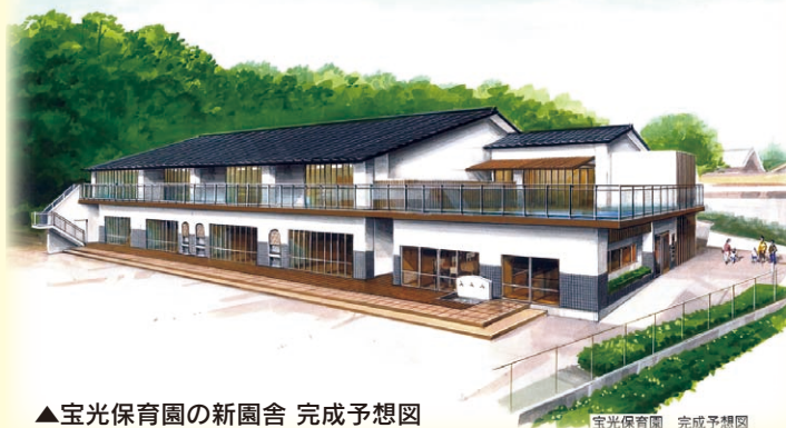
▲宝光保育園の新園舎 完成予想図

そこで町は、町内に4箇所ある保育園に定員増（今年度 80 人）をお願いし、また、そのうち2つの保育園では、費用の一部を国・都・町の補助金で補う形で園舎の建て替えをはじめました。