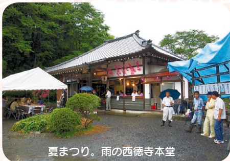
夏まつり。雨の西徳寺本堂

水口の鉦張り念仏の起源は定かではありませんが、鉦に刻まれる年号から天保13年（1842）には既に行われていたと考えられます。昭和初期には、落雷による西徳寺の火災と、時を同じくして始まった太平洋戦争のため、残念なことに一時途絶えてしまいました。その後、昭和40年頃になると、地域の有志の手によって鉦張りの復活に向けた活動が開始されます。しかし、関係書類が火災により焼失していたために作業は難航。戦前の鉦張りを知る、わずか2人の記憶を頼りに、まさに手探りでの復活となりました。