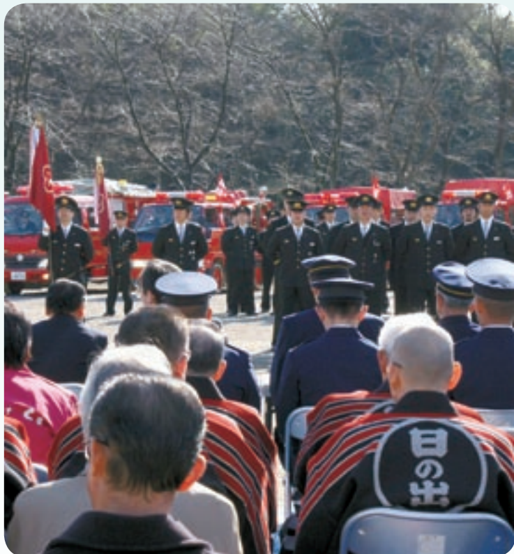
整列する消防団員