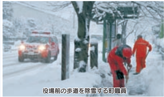
役場前の歩道を除雪する町職員

必要なもの り災証明願（役場窓口で記入）、り災状況写真、印鑑（スタンプ式不可）、身分証明書（代理人の場合は委任状が必要）※保険などにてお使いになる場合は、り災証明書が不要な場合もありますので、必要な書類を各保険会社などにお問合わせください。