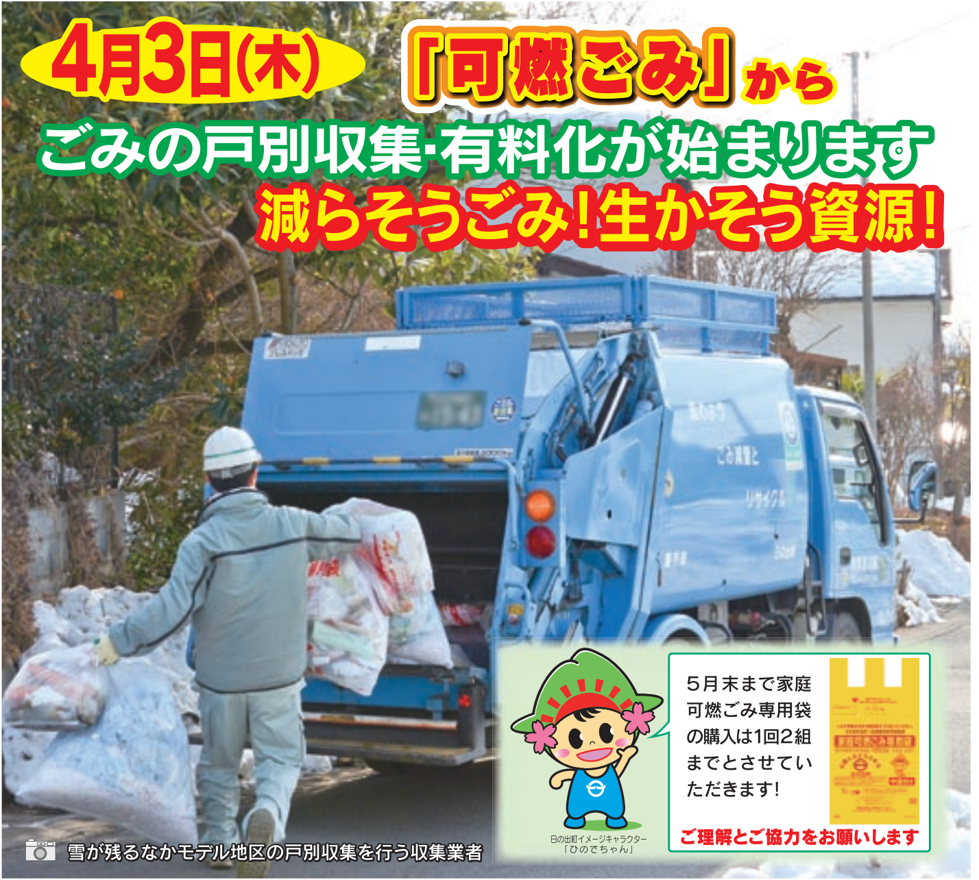
📷 雪が残るなかモデル地区の戸別収集を行う収集業者