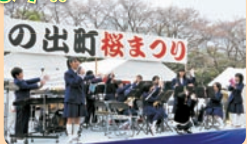
平井中学校吹奏楽部の皆さん 昨年の桜まつりにて

3月5日(水)午前9時より チケットの受付を開始します!! 場所 イオンモール日の出3階 映画館チケット窓口