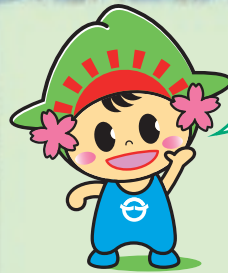
日の出町イメージキャラクター 「ひのでちゃん」