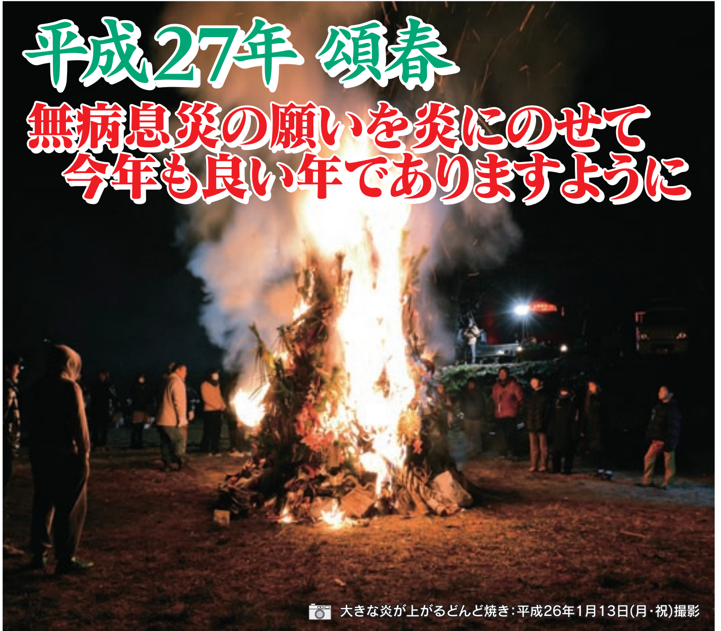
大きな炎が上がるどんど焼き：平成26年1月13日(月・祝)撮影

「日の出町新春の風物詩」どんど焼き(歳の神)は、芯木の周りに青竹を円錐状に立てかけ、萱やスギの葉などを葺き、その周りに正月飾りやダルマなどを飾りつけ焚き上げられます。従来は1月14日の早朝に行われていたそうですが、近年は成人の日や、その前後の日曜日に行われています。どんど焼きの火で繭玉団子を焼いて食べると1年中病気をしない、風邪をひかない、無病息災などと言われています。書初めを燃やして高く舞い上がると字が上手になるとも言われています。 問 総務課 広聴広報係 内線306