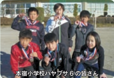
本宿小学校ハヤブサ6の皆さん

秋川流域(日の出町・あきる野市・檜原村)の小中学生による駅伝大会が、東京サマーランドファミリーパークで小学生396人、中学生192人が参加して行われました。競技は、小学生72チームが5区間7.25km、中学生男子20チームが6区間12km、中学生女子14チームが4区間8kmで競い、子どもたちは、寒さをものともせず、元気に各区間を走り切り、達成感に満たされていました。