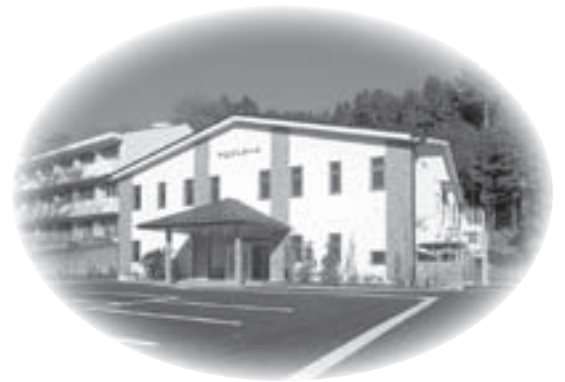
竣工したやまびこホール