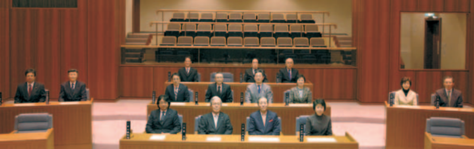
📷 日の出町議会「議場」にて：平成 26 年 12 月撮影