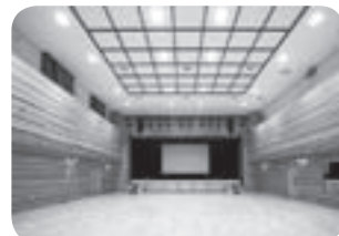
やまびこホール集会室

抽選予約可能回数 ▶やまびこホール、本宿・かやくほ学供、町民グラウンド、スポーツパーク、塩田コート、月8回まで(1団体・1個人)