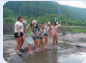
川の水って冷たい！

新島ではあまり親しみのない川。最初は川の水の冷たさに戸惑っていた新島の子ども達。でも慣れてしまえば水遊びは手馴れたもの。存分に川を満喫していました。