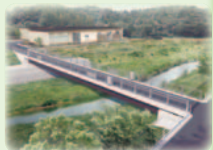
新しい橋のイメージ図