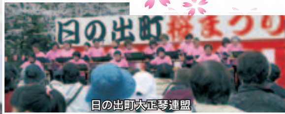
日の出町大正琴連盟