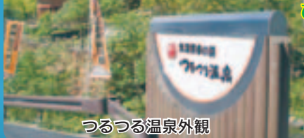
つるつる温泉外観