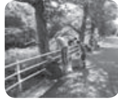
昨年の一斉清掃の様子

一斉清掃は、道路・公園・居住地周辺などを中心に行ないます。多くの皆さんのご協力をお願いします！