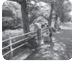
昨年の一斉清掃の様子

一斉清掃は、道路・公園・居住地周辺などを中心に行ないます。多くの皆さんのご協力をお願いします！