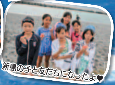
新島の子と友だちになったよ♥