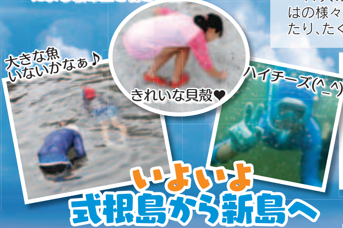
大きな魚いないかなあ♪

日の出町と新島村は、平成20年7月30日に「友好町村盟約」を締結しました。この締結により、隔年で日の出町と新島村を行き来し、交流事業を行っています。今年も、町内の小学5・6年生の子どもたち17人と町職員8人の計25人が新島村を訪問しました。17人の子どもたちは、海水浴やガラスアート制作など新島ならではの様々な体験をし、島の子もたちと交流を深めて住所交換もしたり、たくさんの思い出ができました。 問 総務課 庶務係 内線301