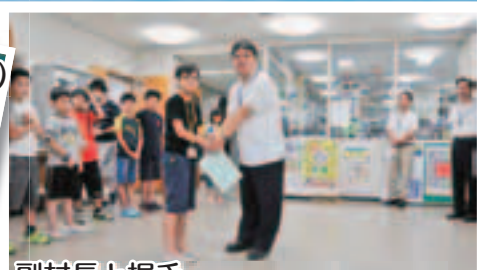
副村長と握手 たくさんの職員の方に歓迎されました