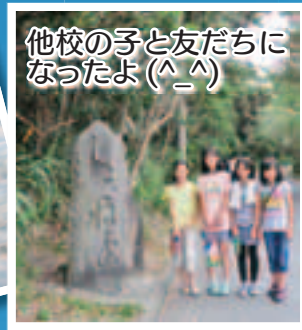
他校の子と友だちになったよ (^_^)