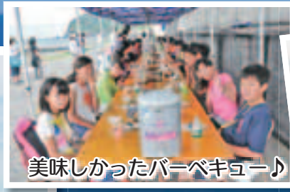
美味しかったバーベキュー♪