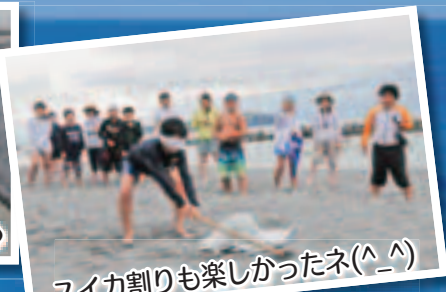
スイカ割りも楽しかったネ(^_^)