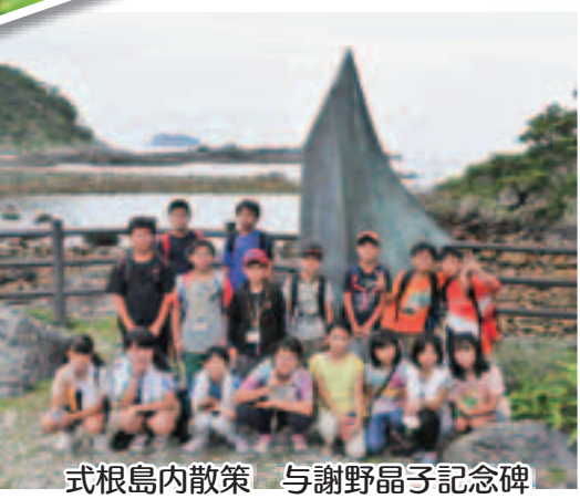
式根島内散策 与謝野晶子記念碑