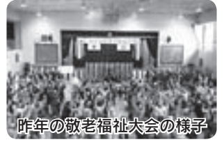
昨年の敬老福祉大会の様子

75歳以上の方を招待し、敬老福祉大会を開催します。最年長の方、満100歳、満90歳、満88歳、満80歳に達した方を表彰し、長寿をお祝いします。表彰者は午後1時から記念撮影を行います。