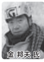
底 邦夫 金