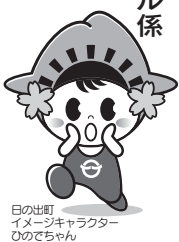
日の出町イメージキャラクターのでちゃん