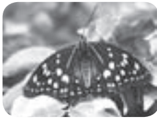
国蝶オオムラサキ

第3回 午後1時30分〜2時30分 申込 不要(直接会場へお越しください) その他 運動靴など歩きやすい靴(ヒール靴不可)、帽子、飲料、雨具(台風などの荒天でなければ実施します)