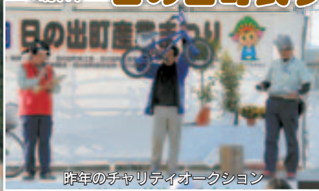
昨年のチャリティオークション