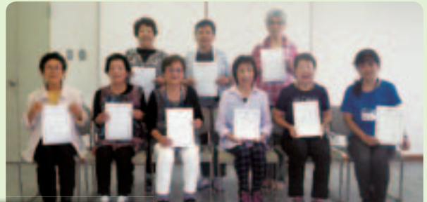
9月に研修を修了した方々