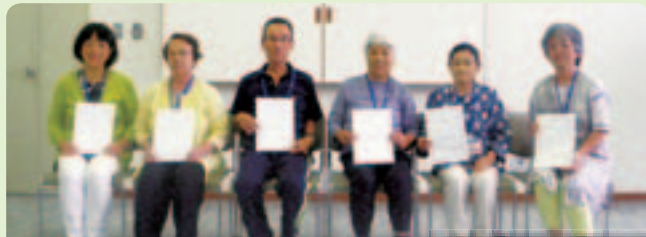
8月に研修を修了した方々

8月21・22日と9月4・5日実施のボランティア研修で17の方が研修を修了しました。修了者には、10月から開始される介護予防・日常生活支援総合事業における「通所型サービスB（住民主体による支援）」のサービス提供者として、本宿老人福祉センターで活動いただきます。本事業は参加者への支援としてのボランティア活動だけではなく、ご自身の「生きがいづくり」としての活動の場を目指しています。