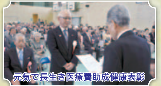
元気で長生き医療費助成健康表彰