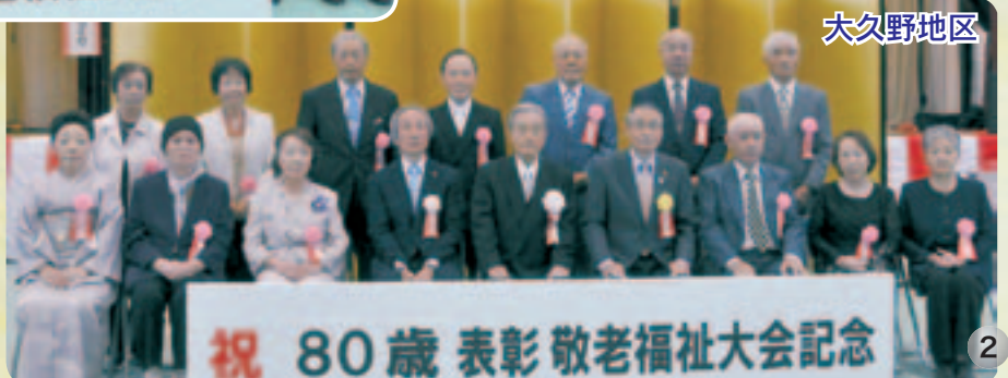
祝 80歳表彰敬老福祉大会記念