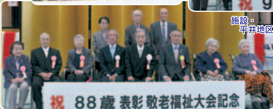
祝 88歳表彰敬老福祉大会記念