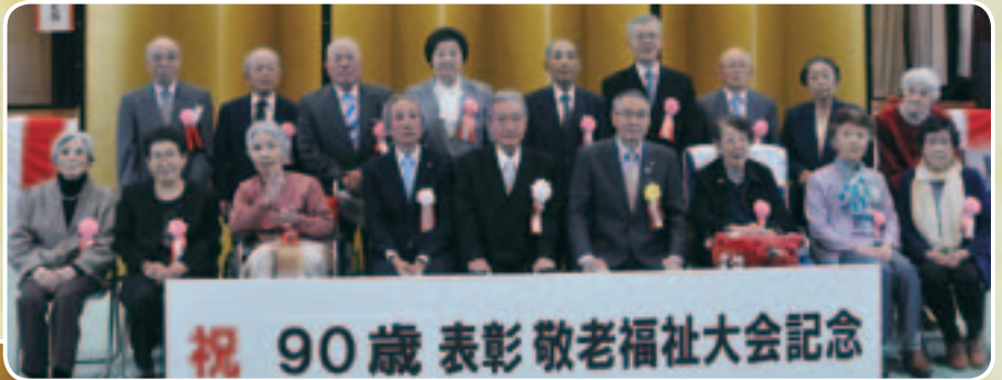
祝 90歳表彰敬老福祉大会記念