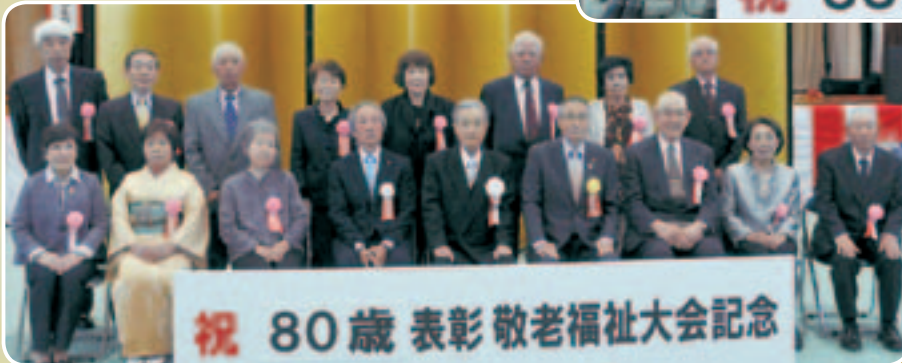
祝 80歳表彰敬老福祉大会記念