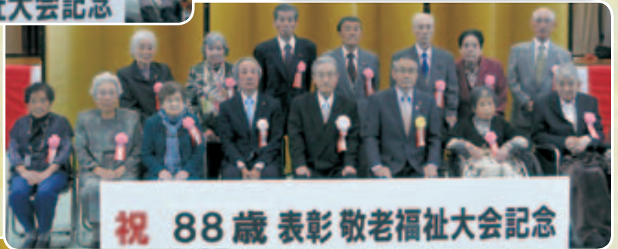
祝 88歳表彰敬老福祉大会記念