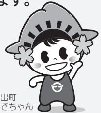
日の出町 ひのでちゃん

受付開始直後と受付期間終了間際は、窓口が大変混雑します。混雑具合により早めに受け付けを締切ることもありますので、余裕を持ってお越しください。