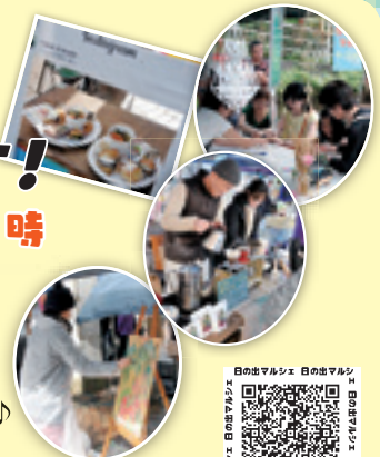
ひのでマルシェ フェイスブックページ

問 日の出サービス総合センター ☎ (597)1009 / 産業観光課 農林振興係 内線 244