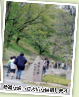
参道を通って大仏を目指します