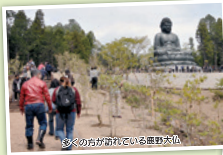
多くの方が訪れている鹿野大仏

数多くのメディアに取り上げられ、一躍有名となった寶光寺が建設した「鹿野大仏」が4月11日から一般公開されました。台座を含めると18メートルの高さになり、近くで見上げると、その迫力に圧倒されます。鹿野大仏は小高い山の上であり、見晴らしも抜群です。山の斜面にはモミジが植樹されており、将来、鹿野大仏と紅葉のコラボレーションが楽しめそうです。注目度抜群の鹿野大仏。まだ訪れていない方は、ぜひ！ 参拝時間 午前9時～午後4時30分