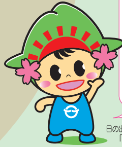
日の出町イメージキャラクター 「ひのでちゃん」

梅雨の時期が やってきます。 気温の寒暖差で 体調を崩さない よう注意しま しょう