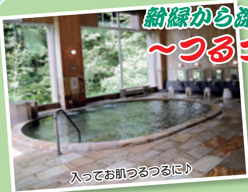
入ってお肌つるつるに♪

日時 7月1日(日) 午前10時～午後8時 ※食堂は午前11時～午後7時 (オーダーストップ)