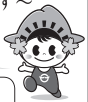
日の出町 イメージキャラクター ひのでちゃん

■取材班は腕章をしています。撮影にご協力をお願いします。 撮影を行う広報職員は、施設管理者やイベント主催者などに承諾を得て、 広報紙などへの掲載を目的として腕章をつけ撮影を行っています。撮影現場では、 口頭での撮影承諾は行いませんが、万が一、撮影されたくないなどの場合は、 撮影している職員までお申し出ください。