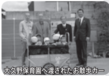
大久野保育園へ渡されたお散歩カー