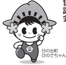
日の出町 ひのでちゃん