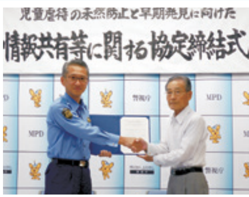
牧之瀬五日市警察署長（左）と橋本町長

6月6日（水）に警視庁五日市警察署と日の出町において「児童虐待の未然防止と早期発見に向けた情報提供等に関する協定」を締結しました。