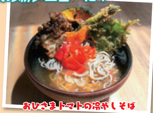
おひさまトマトの冷やしそば

濃厚なひのでトマトの旨味と酸味、昆布とカツオの和風だしとのコラボレーションは絶妙です。ぜひ、ご賞味あれ!! つるつる温泉レストランで販売中!!