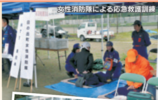
女性消防隊による応急救護訓練