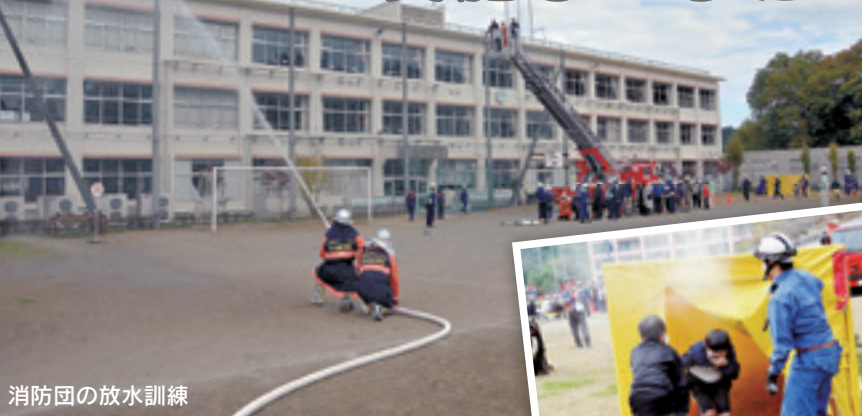
消防団の放水訓練