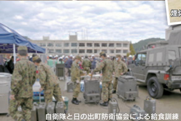
自衛隊と日の出町防衛協会による給食訓練

11月11日(日)に大久野中学校で第12～18自治会を対象に「平成30年度日の出町総合防災訓練」が実施されました。