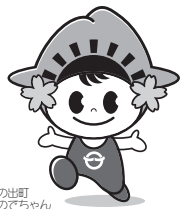
日の出町のでちゃん