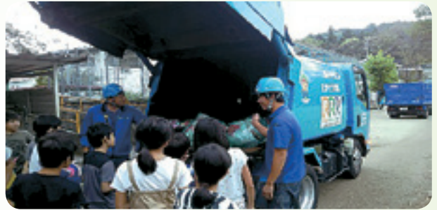
【大久野小学校でのごみ減量についての社会科見学】

本来可燃ごみに混入してはならない、資源物、不燃ごみ、収集不能物も合わせ、より一層の分別徹底が必要です。