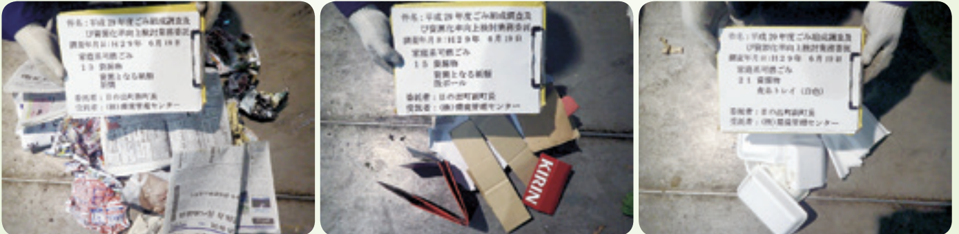
【調査状況…可燃ごみに資源ごみが混入しています】

本来可燃ごみに混入してはならない資源物、不燃ごみ、収集不能物が混入している事例が見受けられます。一層の分別徹底をお願いします。