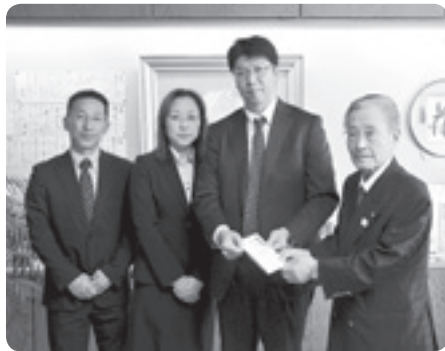
福祉振興として 69,500 円 三吉野工業団地懇話会様

いただきました寄附金につきまして、町の福祉振興のために有効に活用させていただきます。