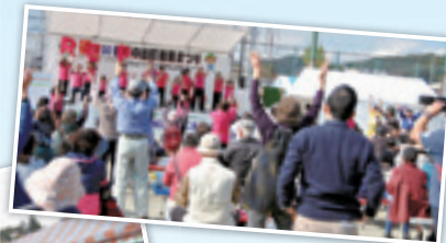
▲会場が一体となってお年寄りスペクト隊と体操