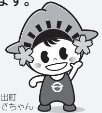
日の出町 ひのでちゃん

受付開始直後と受付期間終了間際は、窓口が大変混雑します。混雑具合により早めに受け付けを締切ることもありますので、余裕を持ってお越しください。