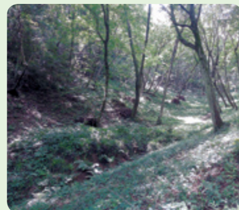
こもれ日がさしこむ里山