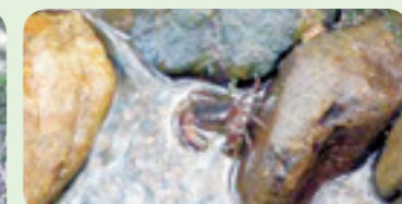
小川に生息するサワガニ