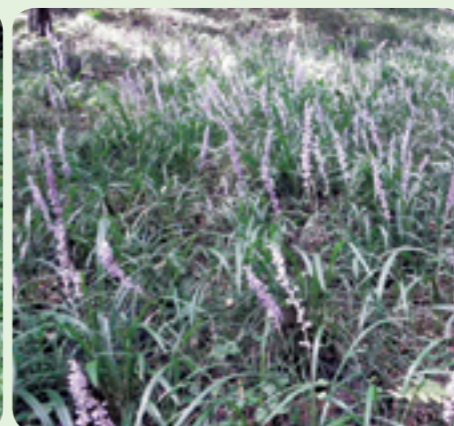
群生しているヤブラン