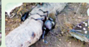
カブトムシとオオムラサキ